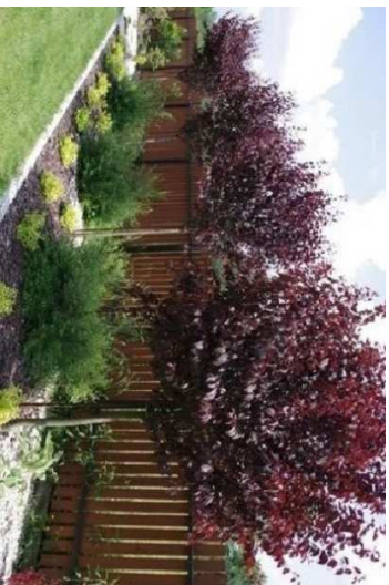
D2 - Śliwa wiśniowa (5 szt. )