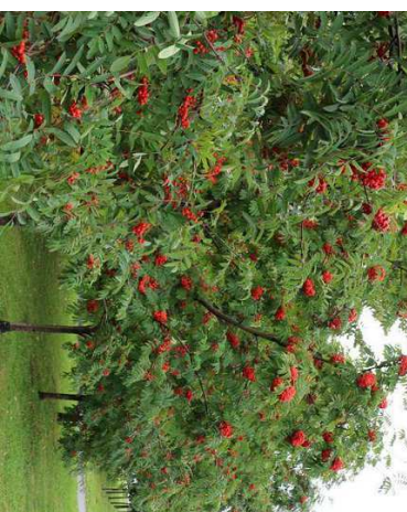
D1 - Jarząb pospolity ( 3 szt.)